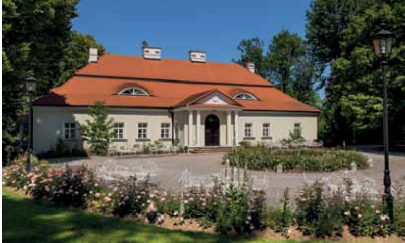
Dwór w Bistuszowej

polskim. Jest to czterospadowy, łamany dach składający się z dwóch części o jednakowym lub bardzo zbliżonym kącie nachylenia połąci. Dworek otoczony jest zabytkowym parkiem z aleją lipową oraz niewielkimi stawami. Pierwotnie znajdował się tu szpaler dębów, z których zachowało się tylko kilka okazów, w tym jeden objęty ochroną jako pomnik przyrody.