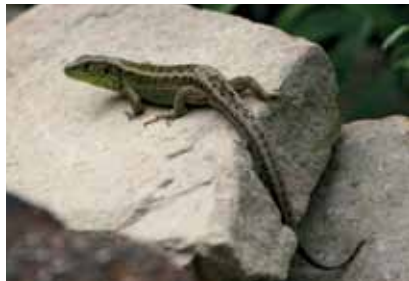
Samiec jaszczurki zwinki

Awifaunę reprezentuje ponad 140 gatunków ptaków. Zaobserwować tu można na przykład dzięcioła czarnego, kruka zwyczajnego, bociana czarnego, myszołowa, jastrzębia, a nawet krogulca. Park jest również siedliskiem życia gadów. Przemierzając jego obszar napotkać możemy węże: zaskrońca zwy-