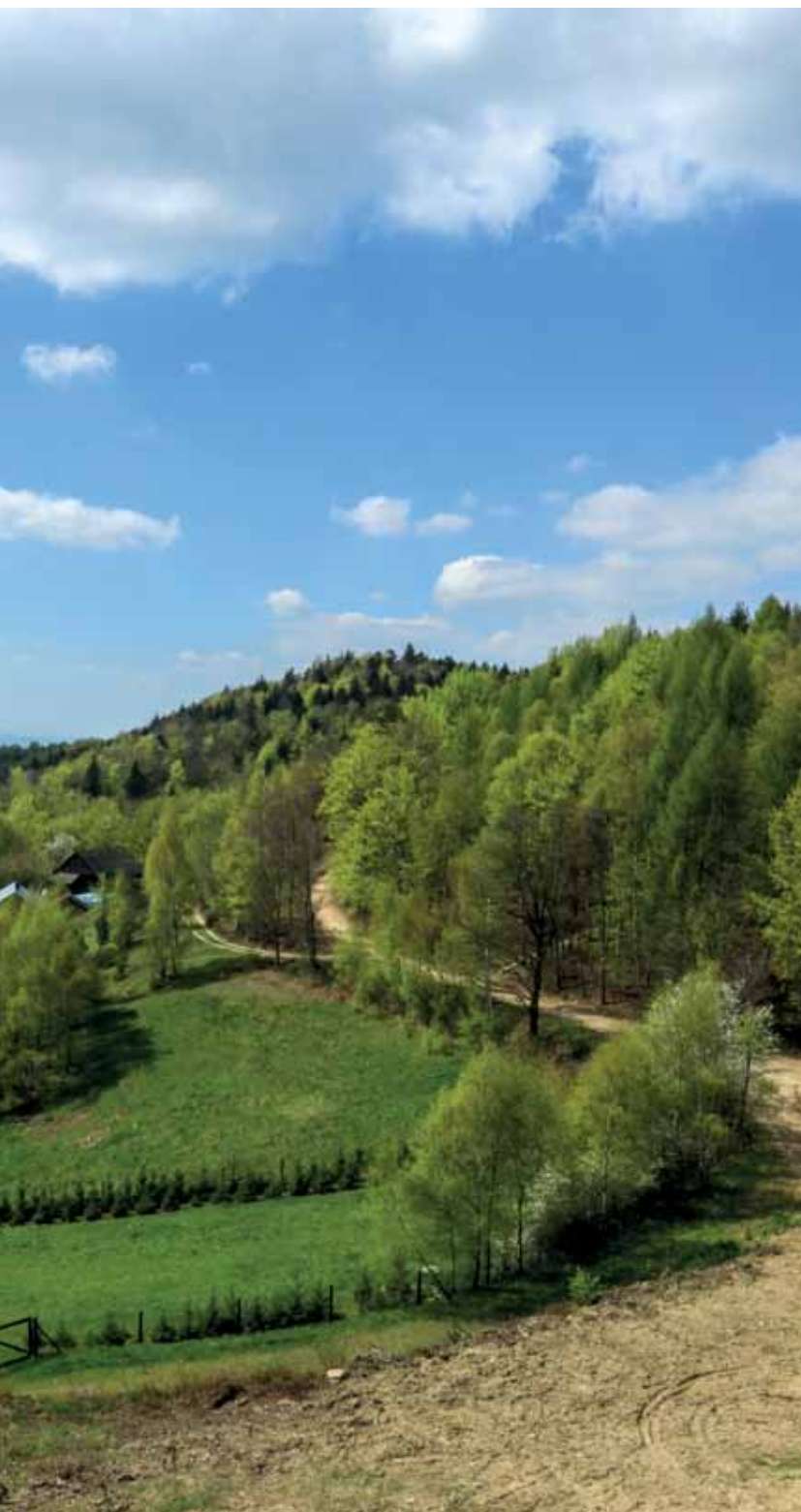
Widok z Brzanki