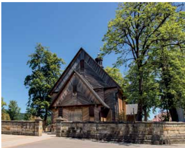
Kościół w Jodłówce Tuchowskiej

Kościół w Ryglicach – neogotycka świątynia pw. św. Katarzyny Panny i Męczennicy, zbudowana w latach 1928–1940.