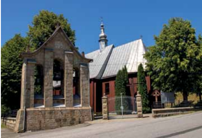
Kościół w Żurowej