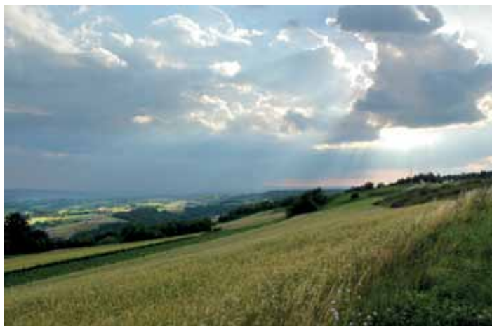
Krajobraz Pasma Brzanki

Na terenie Parku występują różne formy skałkowe w postaci ambon, baszt i grzęd skalnych. Zbudowane są z piaskowców i zlepieńców