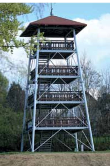
Wieża widokowa w Jodłówce Tuchowskiej