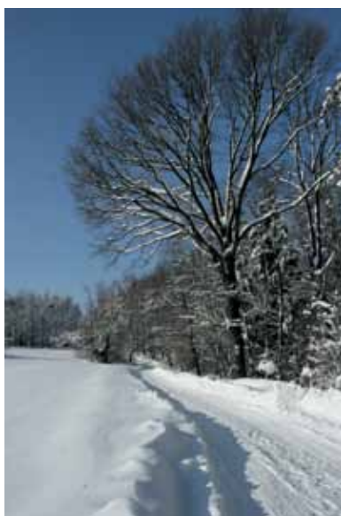
Jodłówka Tuchowska – w drodze na wieżę widokową