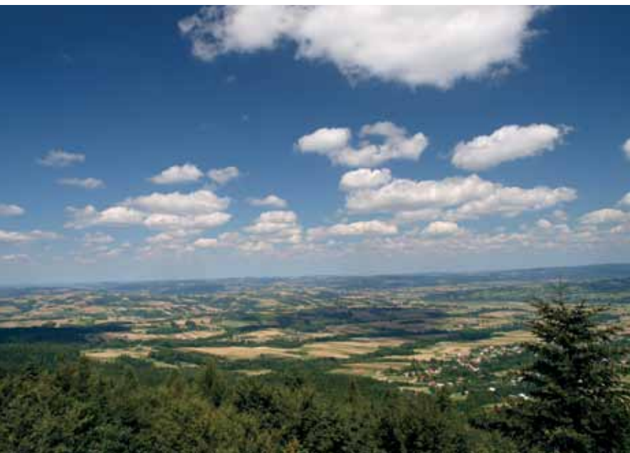
Widok z Liwocza

Przy sprzyjającej pogodzie roztaczają się z niej piękne widoki na nawet bardzo odległe pasma górskie. Na południowym wschodzie widoczne są Bieszczady ze szczytem Chryszczatej i Połoniną Wetlińską. Całą południową część panoramy zajmują wzniesienia Beskidu Niskiego, natomiast na południowym zachodzie widoczne są Pasma Radziejowej i Jaworzyny Krynickiej, należące do Beskidu Sądeckiego. Tuż za nimi zobaczyć można szczyty Tatr. Z kolei na zachodzie dostrzec można Gorce, Beskid Wyspowy, a nawet Babią Górę. W bliższej perspektywie zobaczymy całe Pasma Brzanki.