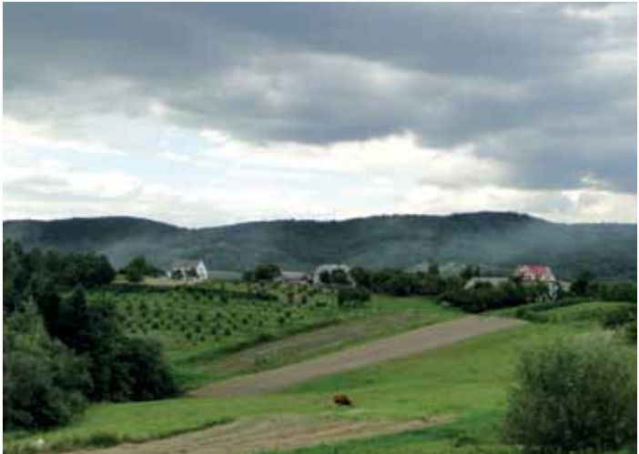
Okolice Jodłówki Tuchowskiej