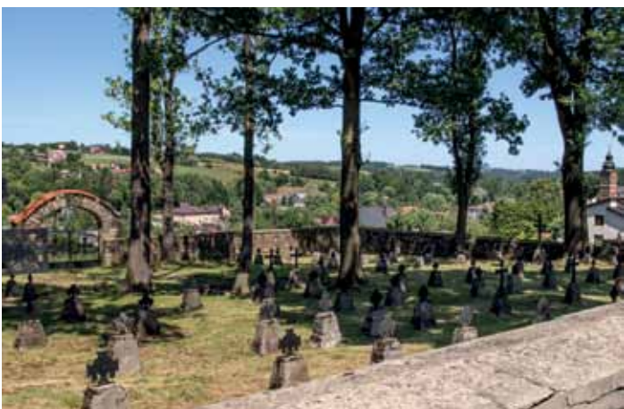
Cmentarz wojenny nr 167 w Ryglicach

-ludowa chrzcielnica pochodząca najprawdopodobniej z XVIII wieku. Z podobnego okresu pochodzi barokowy krucyfiks umieszczony w tęczy. O wiele wcześniejsze, wykonane w pierwszej połowie XVI wieku, są późnogotyckie rzeźby Matki Boskiej Bolesnej i św. Jana Ewangelisty. W kruchcie południowej znajduje się najstarszy zabytek kościoła – wczesnogotycki krucyfiks z drugiej połowy XIV wieku. Tuż przy kościele znajduje się wolnostojąca dzwonnica wzniesiona na przełomie XIX i XX wieku.