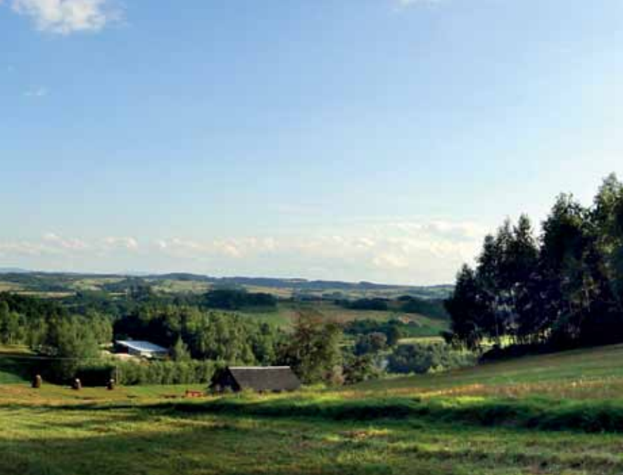
Krajobraz Pasma Brzanki